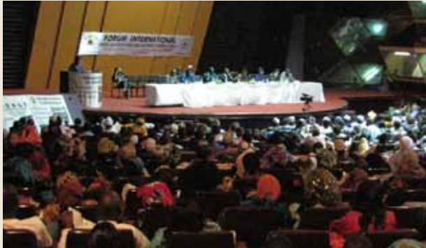
Séance plénière du Forum international.

Du 29 novembre au 1 décembre 2010, le CNCR et la FONGS ont organisé à Dakar, un forum international qui a rassemblé plus de 1000 personnes représentant diverses structures et venant d'une vingtaine de pays.