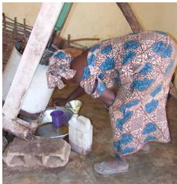
L'innovation technique a besoin d'être appuyée. Ici, une femme transforme une récolte d'arachides en huile.

Cette modernisation devrait idéalement préserver les caractéristiques qui font la force des exploitations familiales et viser l'amélioration de leur productivité globale. Celle-ci est certes liée à l'amélioration des rendements (de la terre et des animaux) mais intègre également l'autonomie alimentaire de l'exploitation et la maîtrise des dépenses familiales.