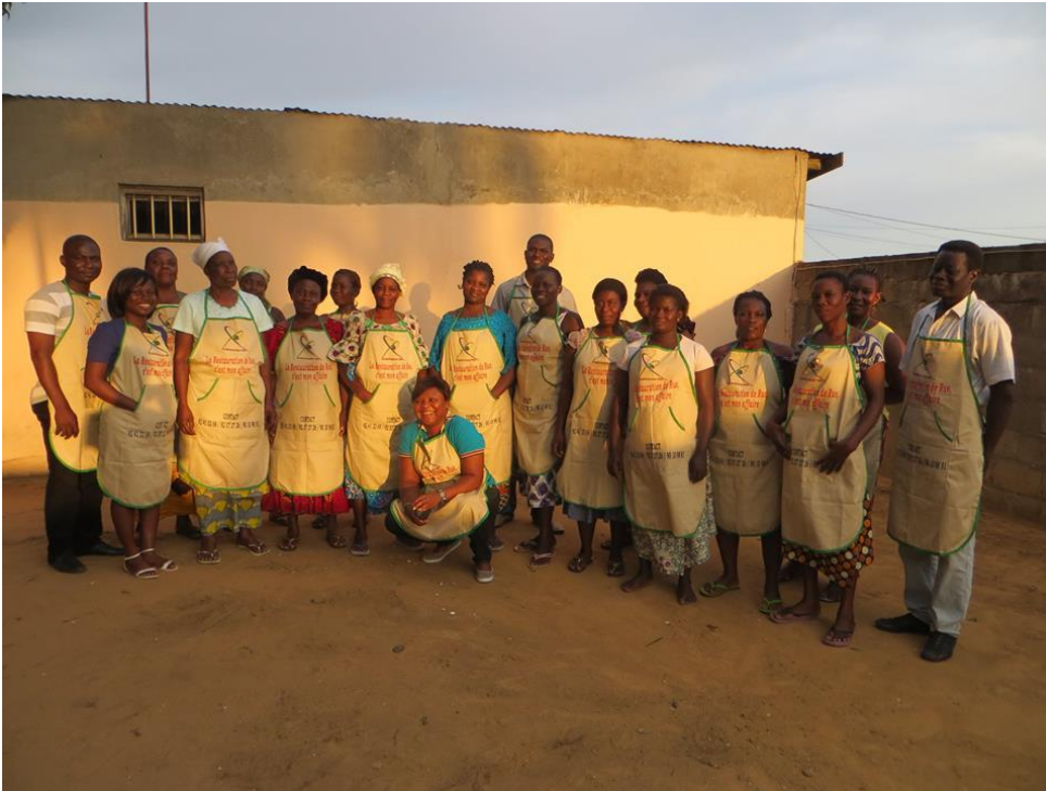
Restauratrices du quartier d'Adamavo en formation

togolais 3 , reste attrayante. Les femmes y trouvent un bénéfice direct avec l'augmentation de leur clientèle. Et elles sont en train d'acquérir un carnet de santé, qui leur permettra d'être protégées en cas de contrôle sanitaire par les services de l'État.