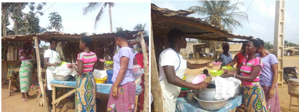
Restauratrices à Lomé

Echoppe avait d'abord essayé de mettre directement en lien paysans et restauratrices. Mais les coûts de collecte, stockage et transport doivent être optimisés pour assurer un approvisionnement de qualité qui reste abordable. Or, l'expérience montre que producteurs et restauratrices n'ont ni la disponibilité, ni les compétences nécessaires pour minimiser ces coûts. Avec quelques investisseurs togolais partageant les valeurs de l'économie sociale et solidaire, Echoppe a créé l'entreprise sociale Planète paysans qui joue un rôle d'intermédiaire entre la ville et la campagne.