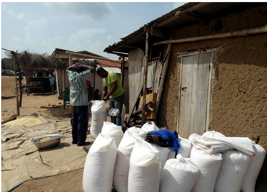
Achat du maïs au village avec une balance électronique

Oui, les paysans obtiennent un meilleur prix avec Planète paysans comparé aux intermédiaires habituels qui achètent dans leur village (120 FCFA le kilo au lieu de 100 FCFA). De plus, le paiement au poids leur est favorable car ils sont souvent trompés par les commerçants. Le maïs vient de Kpélé [à proximité de Kpalimé], une commune choisie pour sa bonne pluviométrie et le fait que les paysans n'y étaient pas du tout accompagnés. Les paysans bénéficient maintenant d'un appui technique. Nous leur fournissons des intrants qu'ils nous remboursent en nature [maïs] à la récolte. De plus en plus de producteurs rejoignent Planète paysans. Pour les autres productions comme le soja, des mises en relations sont faites avec des transformateurs et des exportateurs.