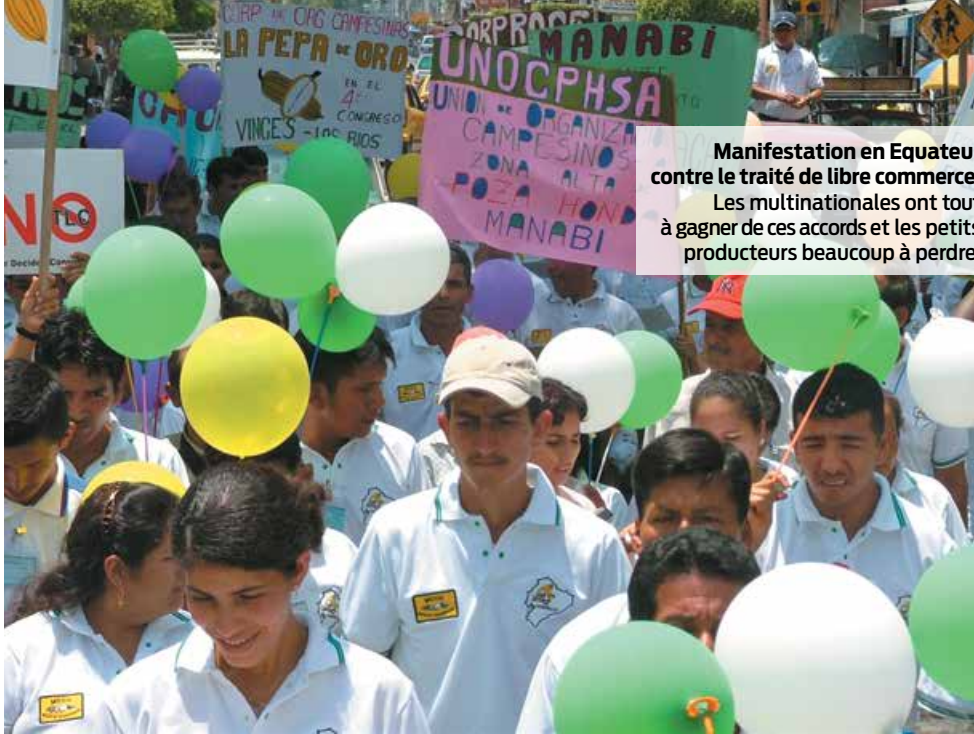
Manifestation en Equateur contre le traité de libre commerce. Les multinationales ont tout à gagner de ces accords et les petits producteurs beaucoup à perdre.