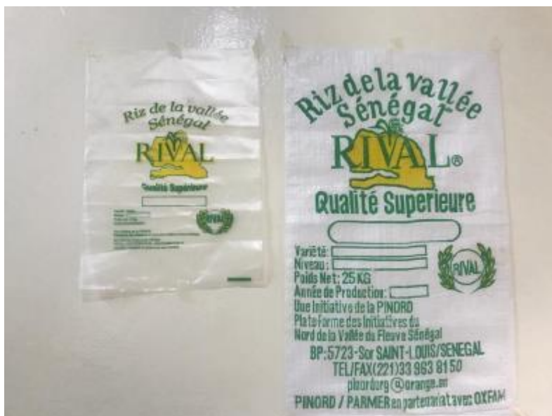
Emballages de la marque de riz Rival de la Pinord.

Le riz issu du SRI ne fait pas l'objet d'une stratégie particulière de promotion ni de commercialisation pour l'instant. Les producteurs l'écoulent assez aisément sur les marchés. Toutefois, le besoin d'une stratégie de promotion pour améliorer la visibilité de ce riz et sa consommation s'imposera sous peu en vue de favoriser l'adoption de cette technique par plus de producteurs. La Pinord pourra s'inspirer de son expérience dans la création, en 2007, de la marque Rival pour la promotion du riz local. Cette initiative souhaitait répondre au problème de la qualité du riz local face à la concurrence du riz importé. C'est surtout l'adoption de l'approche participative impliquant différents acteurs, notamment les producteurs et les transformateurs membres de la Pinord, qui a permis les résultats enregistrés. Les différents acteurs ont été associés à toutes les étapes de création de la marque : identification des variétés, définition des itinéraires techniques tant pour la production que pour la transformation, élaboration et adoption de la charte qualité, expérimentation, vulgarisation etc. Depuis 2007-2008, la marque Rival est inscrite et protégée par l'Organisation africaine de la propriété intellectuelle (OAPI).