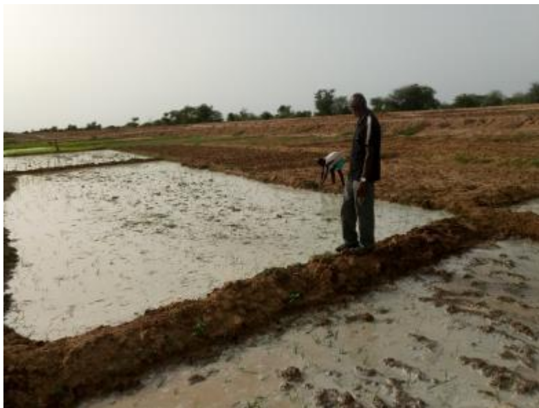
Visite de la parcelle d'un bénéficiaire du Pamera appliquant le SIR.

Les bénéficiaires du projet mené par la Pinord ont obtenu jusqu'à 3 tonnes de plus par hectare qu'en riziculture conventionnelle. Par ailleurs, la non-utilisation d'intrants chimiques (engrais et pesticides) prévue par le SRI a réduit de 30 % les coûts d'exploitation par rapport à la technique conventionnelle.