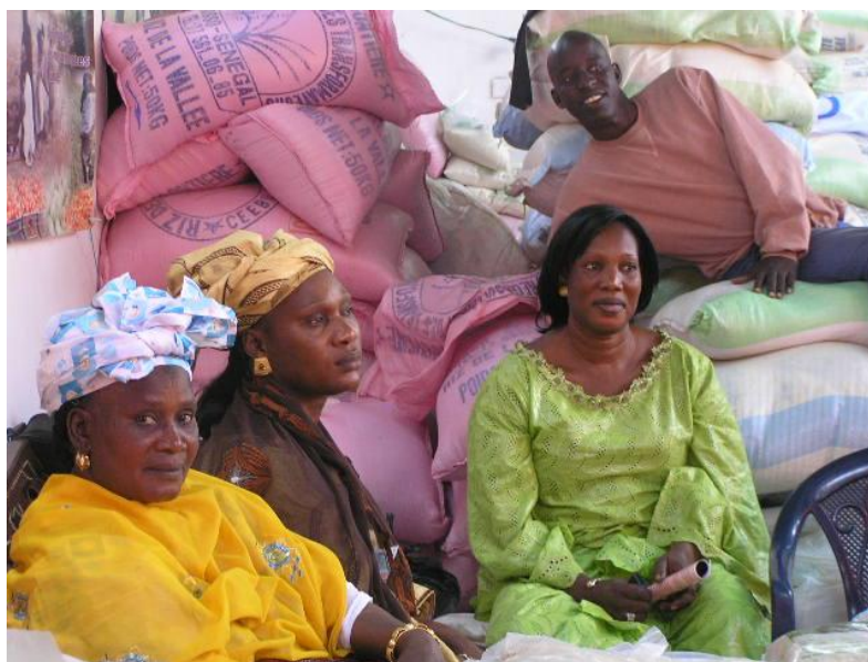
Participation de la Pinord à la Foire internationale de l'agriculture et des ressources animales (Fiara) de 2007.

Aussi bien chez les femmes que chez les jeunes, on constate une amélioration de leur implication et de leur participation au développement de la communauté. Ils sont davantage présents dans les organisations paysannes y compris au sein des instances de décision. Il importe de souligner que les jeunes ont obtenu un revenu conséquent après la mise en place du SRI, ce qui leur a donné de nouvelles perspectives quant à la production agricole. En effet, nombre d'entre eux étaient sans revenus et donc tentés par l'émigration clandestine avec tous les risques que cela comporte.