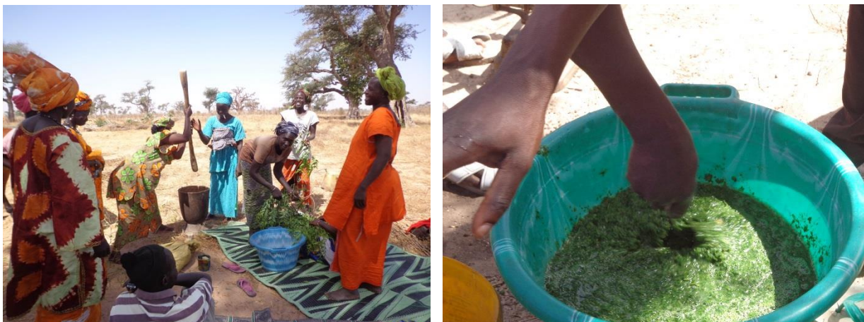
Préparation d'un traitement naturel