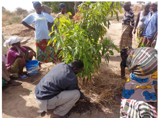
Pépinière et plantation dans un objectif d'embocagement des parcelles