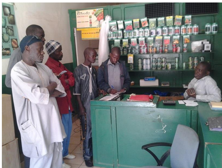
Rencontre des maîtres exploitants avec un fournisseur d'intrants

Un accompagnement de la relation avec les fournisseurs facilite également l'accès aux semences.