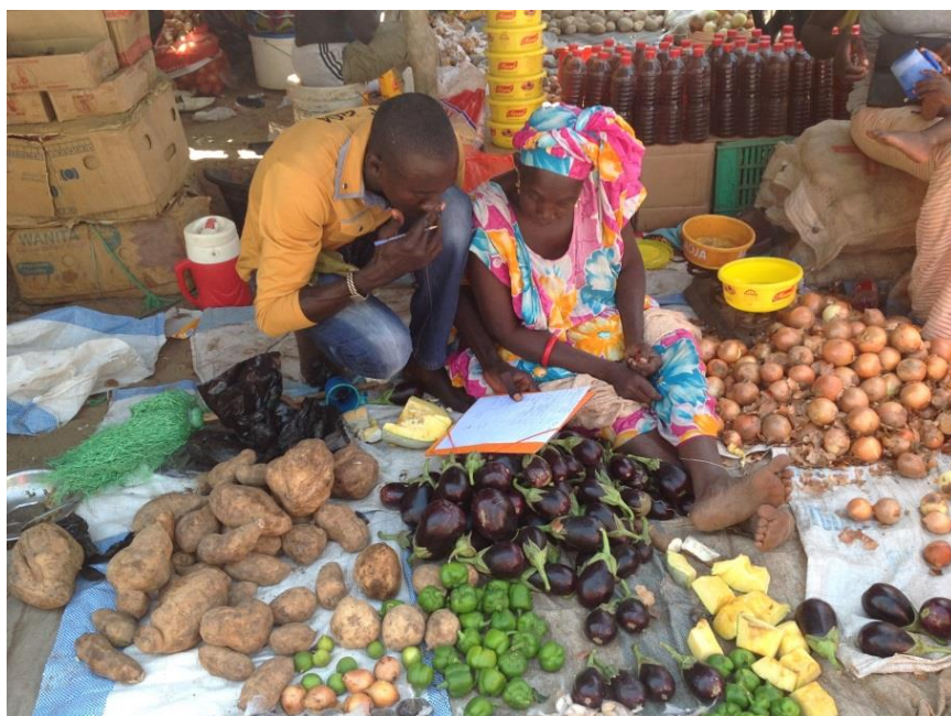
Relevé hebdomadaire de prix sur le marché de Mbfaye

Grâce au SIM, nous réfléchissons avec les techniciens et les agriculteurs à une stratégie de planification des cycles culturaux. L'idée est que les agriculteurs commencent le cycle cultural au moment le plus propice pour assurer une récolte lorsque les prix sont satisfaisants.