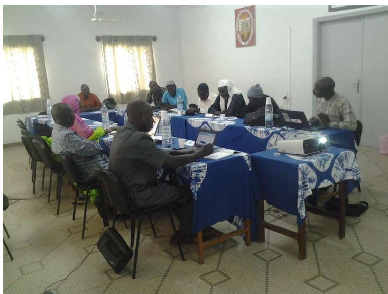
Atelier de partage avec la plateforme

Les acteurs de la plateforme ont identifié quatre grandes contraintes au plan environnemental : la pauvreté des sols en matière organique, la salinité des eaux, la présence du striga (adventice qui parasite le mil) et les inondations des parcelles. Pour chaque obstacle, des techniques sont proposées par les acteurs de la plateforme afin de dépasser ou limiter ces contraintes ; elles sont ensuite testées avec les producteurs.