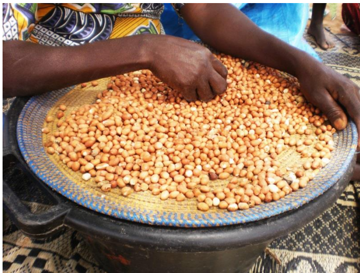
Les transformatrices achètent aux producteurs l’arachide en graines et les décortiquent à la main

respecter. Face aux problèmes d’approvisionnement, nous aimerions pouvoir développer des relations contractuelles entre les transformatrices, les producteurs et l’UGPM. L’intérêt d’un tel contrat est d’assurer aux transformatrices l’approvisionnement en matière première et aux agriculteurs la vente de leur production. Afin d’assurer un approvisionnement minimum en graines d’arachide, l’UGPM souhaite aussi développer de nouveaux partenariats avec des producteurs au-delà de la région de Méckhé.