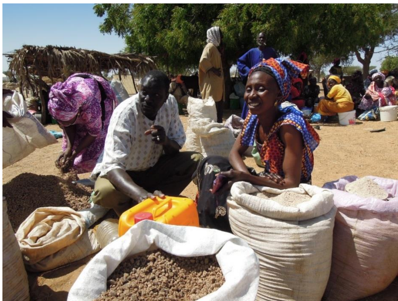
Une partie de l'huile est consommée au sein du ménage, les surplus sont vendus sur les marchés locaux

Un cabinet de conseil de Dakar, le Groupe d'expertise en recherche, action et formation pour le développement (GERAF) accompagne l'UGPM sur les aspects de commercialisation et de marketing. L'UGPM a ainsi réalisé un plan de commercialisation de l'huile d'arachide locale pour Dakar et les autres centres urbains du pays. Le cabinet a aussi prospecté auprès de différents points de vente et formé un agent commercial. Élaborée de manière participative avec l'équipe du projet, les transformatrices, les jeunes revendeurs, la stratégie commerciale est prête, mais nous sommes bloqués par l'absence d'autorisation de commercialisation du produit.