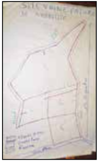
Carte du site de gestion concertée de la vaine pâture de Nambitite (Biankouri)

cantonal, un comité sur la contractualisation foncière a été mis en place afin d'élaborer un contrat de location de terre de moyen et long terme prenant en compte des pratiques agroécologiques ( apports de fumure organique, reboisements, ouvrages CES, etc. ).