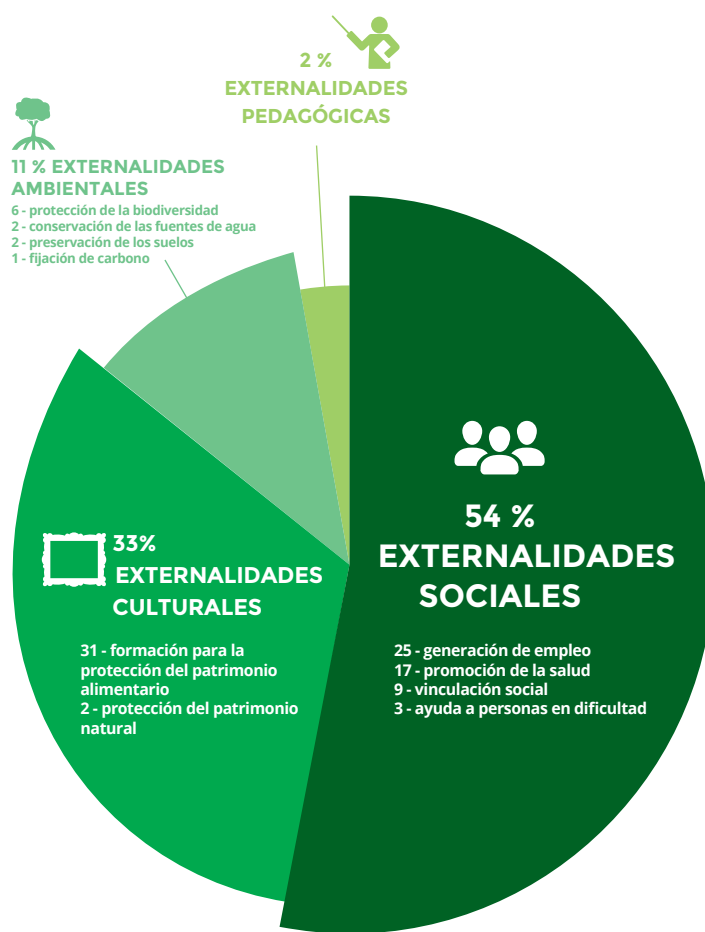
Gráfico 5. Tipos de externalidades principales generadas por las iniciativas

Por otra parte, las externalidades positivas se ubicaron en las siguientes categorías generales: 1) sociales; 2) culturales; 3) pedagógicas y 4) ambientales. En cuanto a la especificidad por categoría, las externalidades pedagógicas, orientadas a la formación y educación de las personas resultaron ser las menos presentes, identificándose únicamente 2; contrario a la preponderancia de las externalidades positivas sociales, - 54 en total- en tanto externalidad principal, frente a las culturales, ambientales y pedagógicas; que en su conjunto sumaron 46 externalidades.