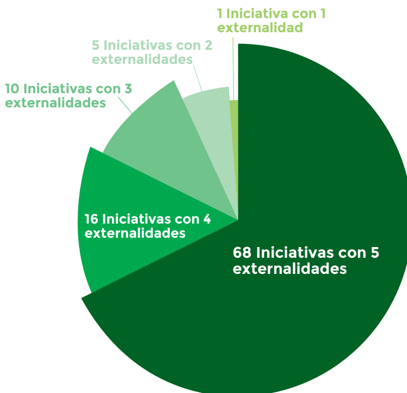
Gráfico 4. Externalidades generadas por iniciativa

Las externalidades positivas se analizaron dentro de una categorización de cinco tipos. Esto por cuanto una misma iniciativa genera otras externalidades. En cada iniciativa se identificaron una externalidad principal y cuatro secundarias. Lo anterior permitió constatar que sólo en un caso, una iniciativa generó una única externalidad positiva; siendo por lo tanto, una característica general que las iniciativas SAT producen efectos positivos múltiples.