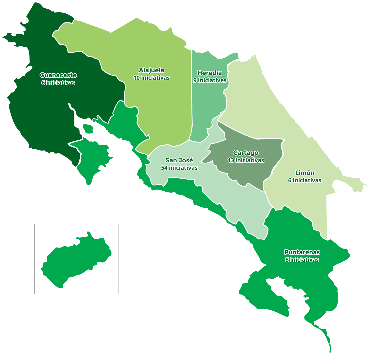
Gráfico 1. Distribución de las iniciativas por provincias