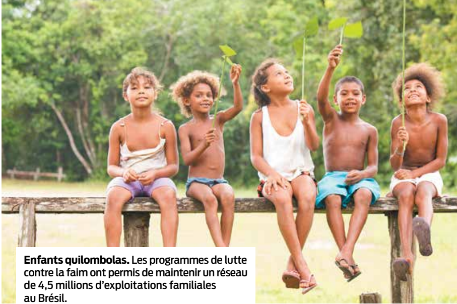
Enfants quilombolas. Les programmes de lutte contre la faim ont permis de maintenir un réseau de 4,5 millions d'exploitations familiales au Brésil.