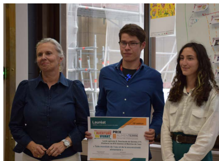
Lycée agricole Georges Desclaude de Saintes (17)