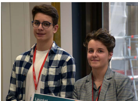
Collège Anne Frank de Brives-Charensac (43)

Le Prix 2023 a été attribué aux élèves et étudiants du :