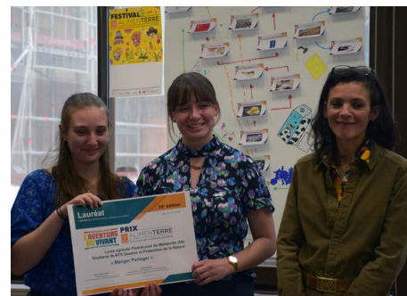
Lycée agricole de Pixérécourt Malzéville (54)