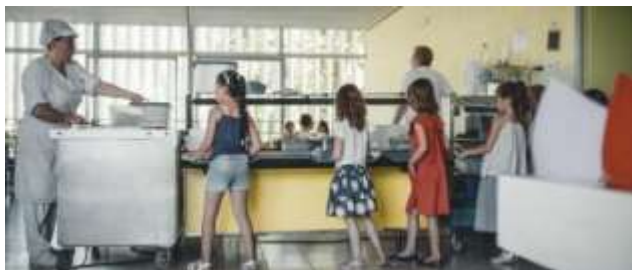
Recettes pour un monde meilleur