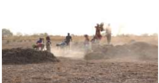
Semer, récolter, résister