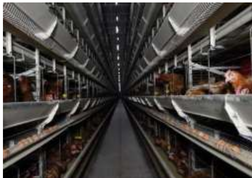
Pauvres poulets, une géopolitique de l'œuf