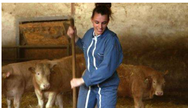
Femmes de la terre