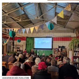
ASSOCIATION DES GÉRÉS PLEIN LA TERRE