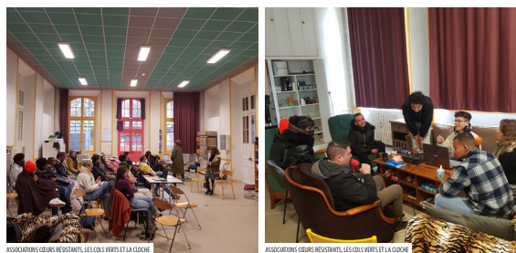
ASSOCIATIONS GÉRÉS RESTAURANTS, LES COLS VERTS ET LA GLOUCHE