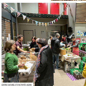
CENTRE CULTUREL ET D'ACTIVITÉS AGRIQUES

Depuis 2021, Xylm est la coordination départementale ALIMENTERRE d'Ille-et-Vilaine, ce qui a permis de faire naître de véritables synergies sur le territoire. Une multitude d'actions et de projections ont été organisées par des acteurs variés. Au final, le nombre de structures investies dans le festival est passé de 39 en 2021 à 98 en 2022 et le nombre d'événements organisés a plus que doublé sur la même période (50 en 2021, 104 en 2022). En tout, 4 113 personnes ont été sensibilisées au cours de l'édition 2022 d'ALIMENTERRE, dont 80 % de publics « éloignés » (jeunes, ruraux, quartiers prioritaires de la politique de la ville).